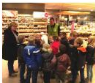
Een winkel bezoeken

"We hebben klusjes gedaan op school. Ook voor de directeur. We kregen overal muntjes voor. Die deden we in een eigen gemaakte spaarpot. Daardoor konden we dingen kopen in onze winkel met zelfgemaakte spulletjes. De winkel werd steeds groter. Een stukje van de winkel hebben we nog steeds."