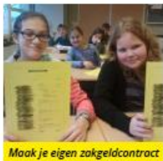
Maak je eigen zakgeldcontract

"We mochten met z'n tweeën zelf een dienst bedenken om te verkopen. Wij kozen voor onkruid wieden. Een echte verkoper kwam vertellen hoe je een dienst moet verkopen. Dat je goed moet vertellen wat je wel en niet doet, dat je heel beleefd moet zijn en ook van tevoren een prijs moet afspreken. We hebben samen wel 6,50 euro verdiend!"