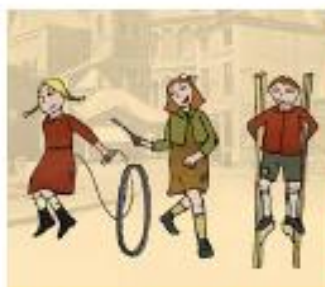
Speelgoed van toen

"Reclame moet je niet altijd geloven. Het lijkt soms mooier dan in het echt. We hebben een speelgoedmarkt gemaakt en mochten daarvoor ook reclame maken. Maar dan wel eerlijke reclame. Een mevrouw die veel over reclame maken wist, hielp ons. Papa's en mama's kwamen spulletjes kopen."