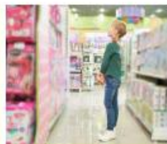
Kopen of niet kopen?