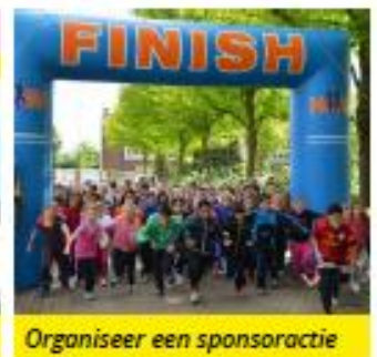
Organiseer een sponsoractie