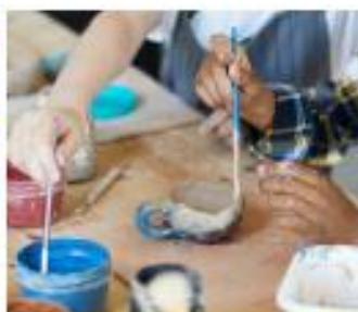
Maak een kado van klei