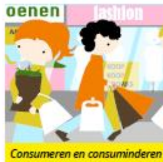
Consumeren en consuminderen

"Elk groepje kreeg 5 euro van de directeur te leen. Daar gingen we ons eigen bedrijf voor oprichten. We moesten geld gaan verdienen. Wij wilden armbandjes verkopen. Een ondernemer hielp ons met een begroting maken. We hebben kralen en touw ingekocht en slingers voor de versiering van onze kraam. De armbandjes hebben we voor 60 cent verkocht. Op het laatst hebben we de 5 euro teruggegeven aan de directeur en 220 euro ging naar het goede doel."